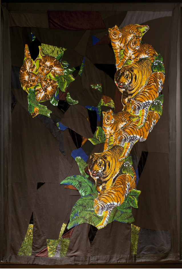
Kaplaniye , 1983 Kumaş kolajı 250 x 190 cm © Sanatçı Tansa Mermerci Koleksiyonu