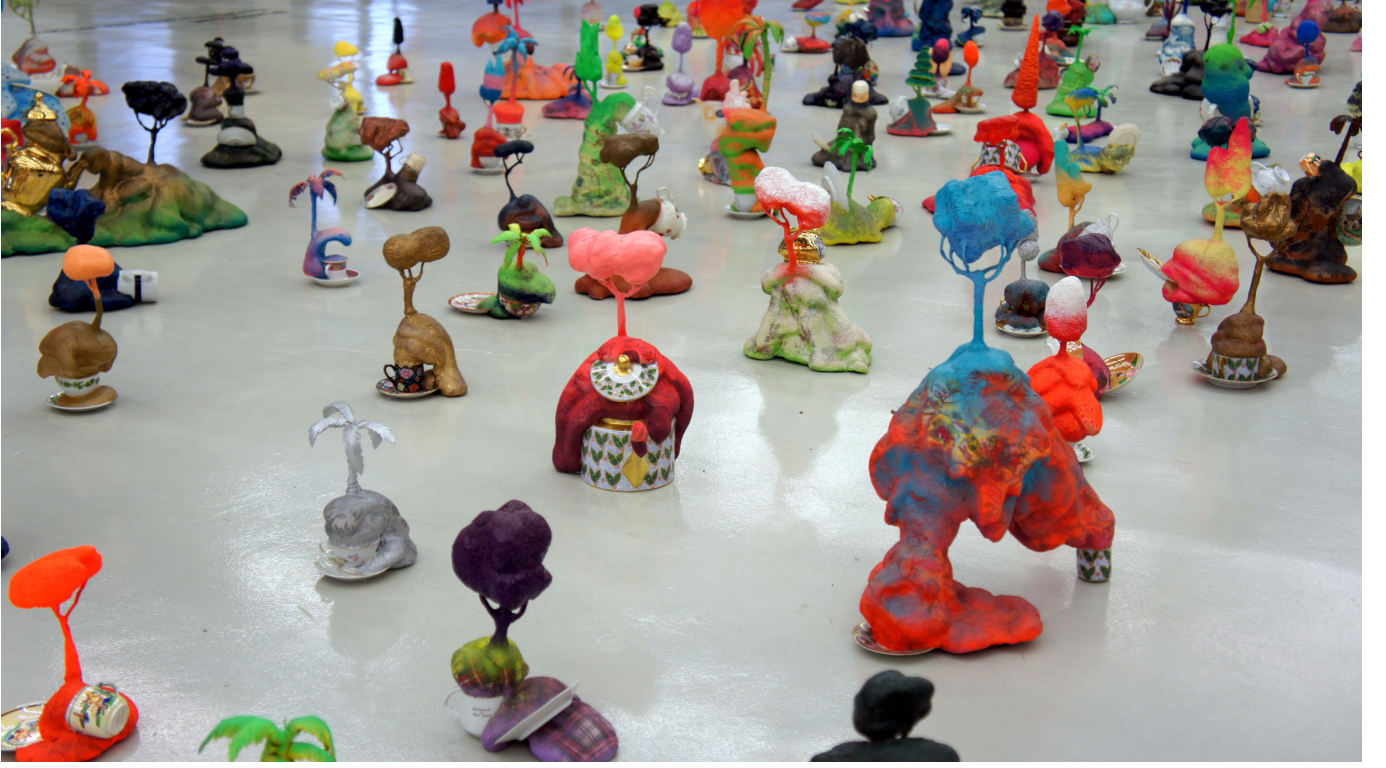
Yemek Odasındaki Bu İnsanlar , 2012-2014.

Sprey boya, soğuk porselen, poliüretan köpük, tel, akrilik reçine ve porselen üzerine kâğıt hamuru