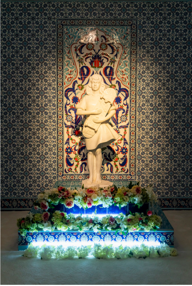
Mabet , 2016 – 2020 Yerleştirme Heykel, çini karo, yapma çiçek © Sanatçı