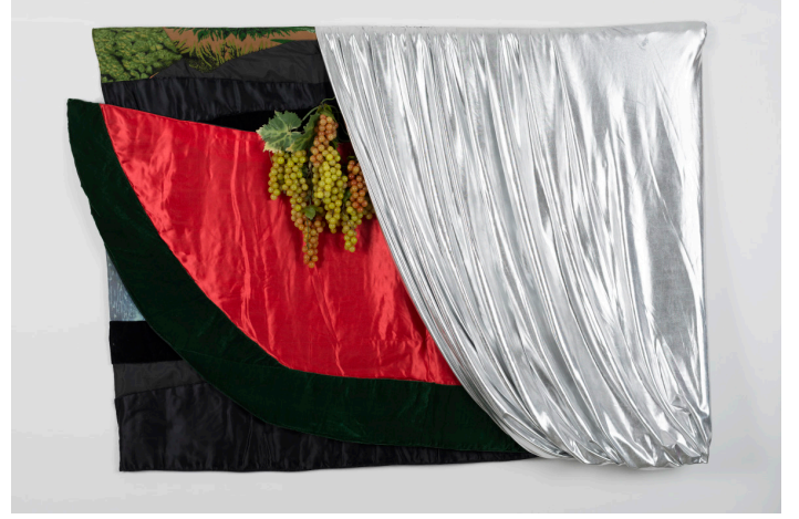
Karpuz , 1986 Kumaş, buluntu nesne 100 x 143 cm © Sanatçı Büro Sarigedik