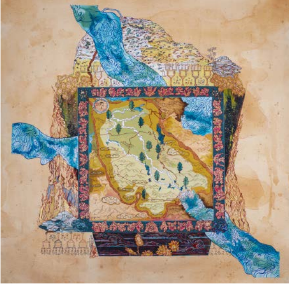
Rahime , 2019, Şattülarap'ın kurgusal haritası, Kâğıt üzerine guaj, suluboya, mürekkep ve altın, 70 x 70 cm Sanatçının izniyle