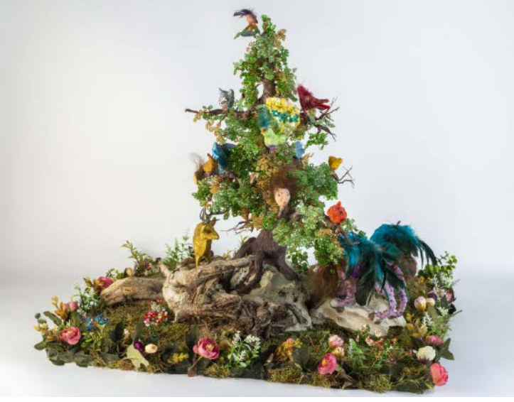
Güzel ve Çirkin (Aslan ve Ceylan), 2020, Karışık teknik, 55 x 70 x 75 cm Sanatçının izniyle SPOT desteğiyle üretilmiştir.