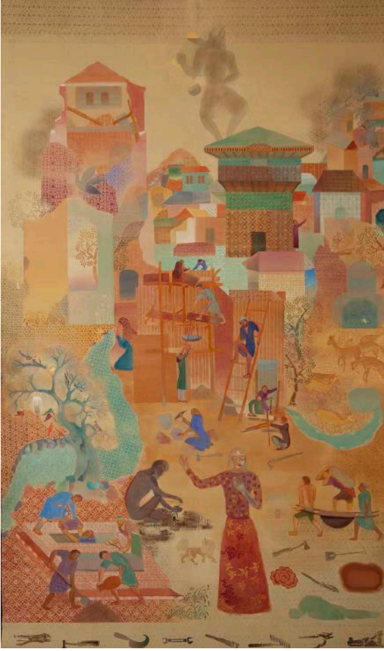
İnşaat Alanı , 2010.

Tuval üzerine kazein boyası, 305 x 183 cm