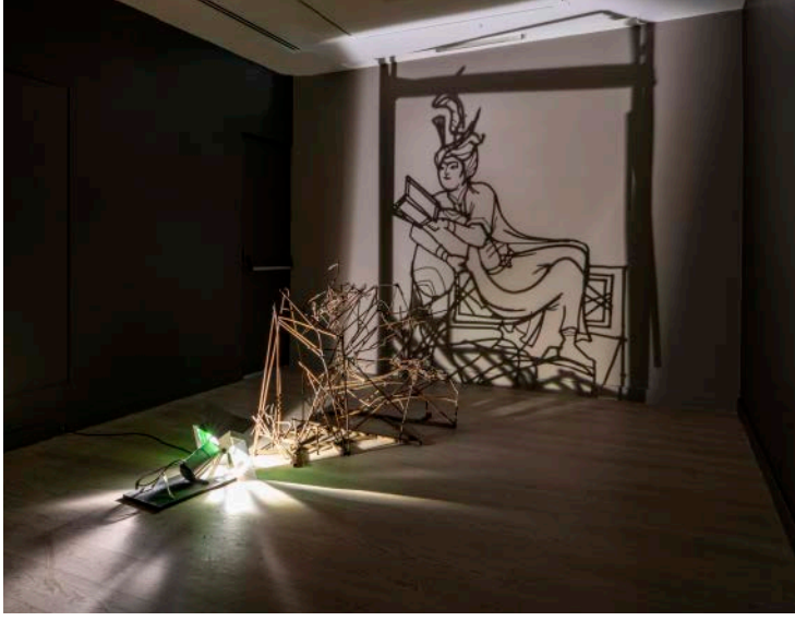
Minyatür (Prens kitap okuyor), 2013, Demir, 110 x 110 x 110 cm Sanatçının izniyle