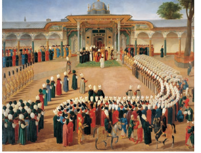
Kapıdağlı Konstantin, Sultan III. Selim'in Cüfus Töreni , 1789, Tuval üzerine yağlı boya (Halil Altındere'nin eserinin çıkış noktası olan orijinal tablo)