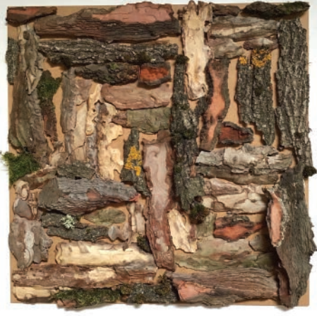
Doğa , 2020 50 x 50 cm, Ahşap üzerine sabitlenmiş ağaç parçaları