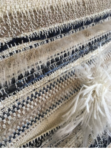
İsimsiz, 2020 103 x 41 x 10 cm, Dokuma