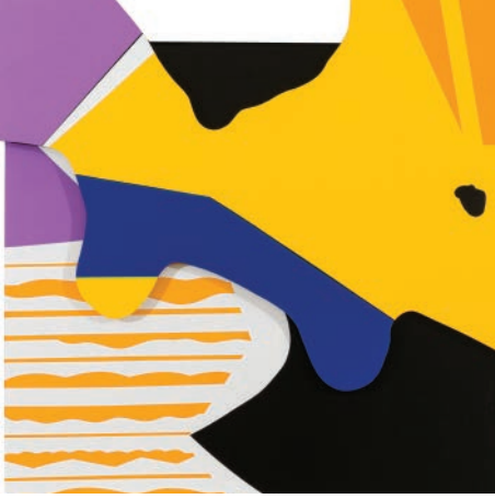
No: 070919, 2019 Çok katmanlı alüminyum