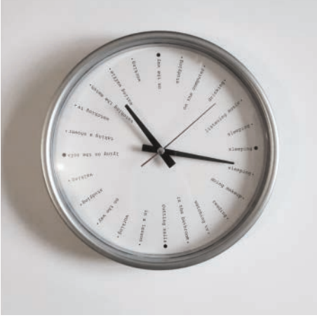
An, 2018 Çap: 28 cm Hazır obje ve dijital baskı