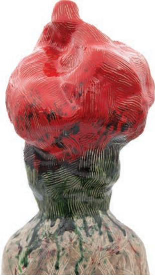
Kırmızı Kaktus , 2020 52 x 30 x 22 cm, Seramik