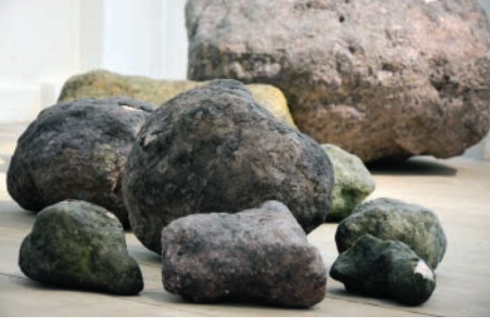
Taş-ı-yorum , 2018 - 2019 Çeşitli boyutlarda mekâna özgü yerleştirme, Kâğıt hamuru